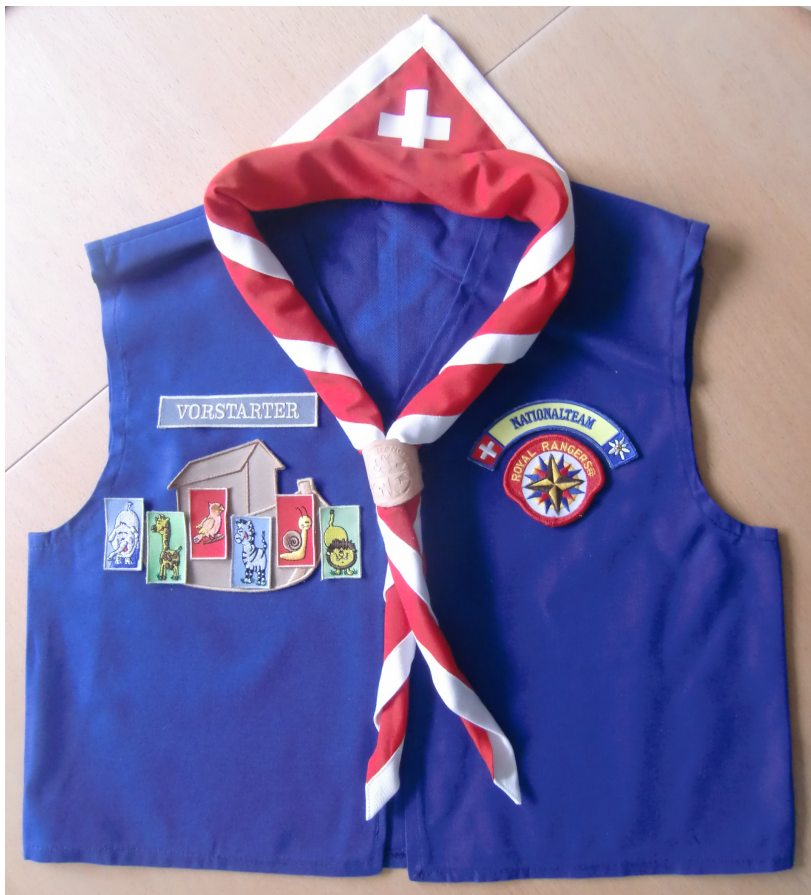
Jeansweste für Starter